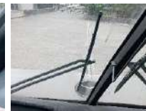
LUNA DE ESPEJO CONCAVO Y PLUMAS DE LIMPIADORES