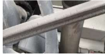
CAMBIO DE BANDAS DE SISTEMA DE AIRE ACONDICIONADO Y ALTERNADOR