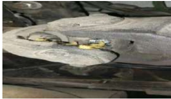
CRUZETA SALIDA DE TRANSMISION