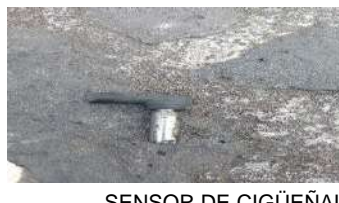
SENSOR DE CIGÜEÑAL