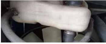
CAMBIO DE ANTICONGELANTE