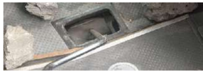
CUBREPOLVO DE PALANCA BAYONETA DE HIDRAULICO